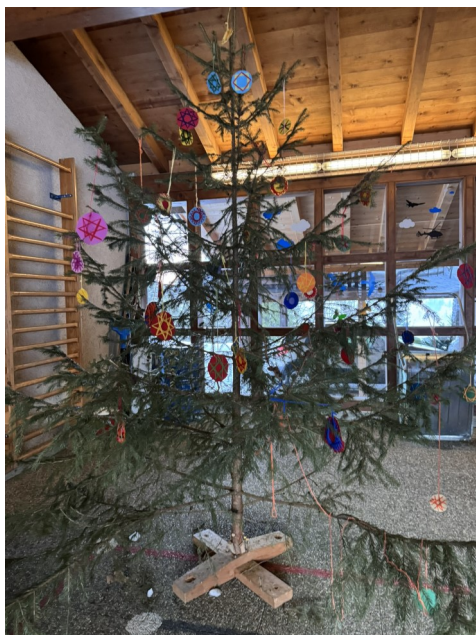
Die Partnerkinder bastelten gemeinsam Sterne und schmückten damit den grossen Weihnachtsbaum in der Pausenhalle.