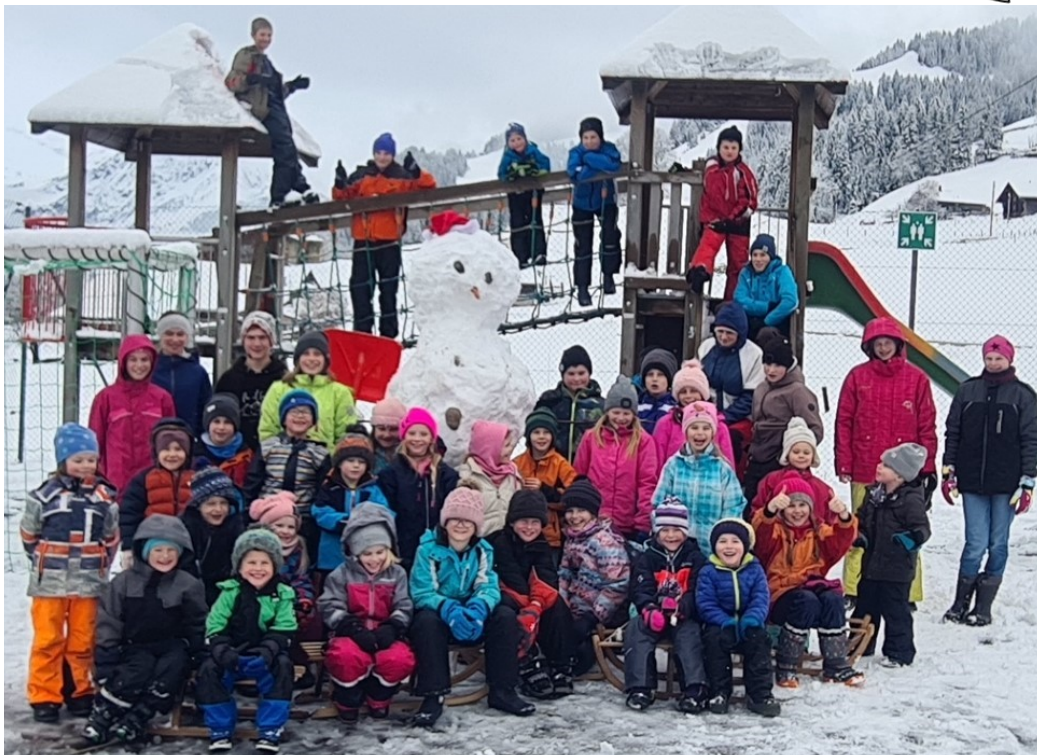
Aus dem ersten Schnee wurde in der Pause ein Gemeinschaftswerk gebaut - ein riesiger Schneemann.